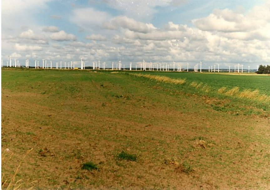
Abb. 14: Verriegelte Landschaft