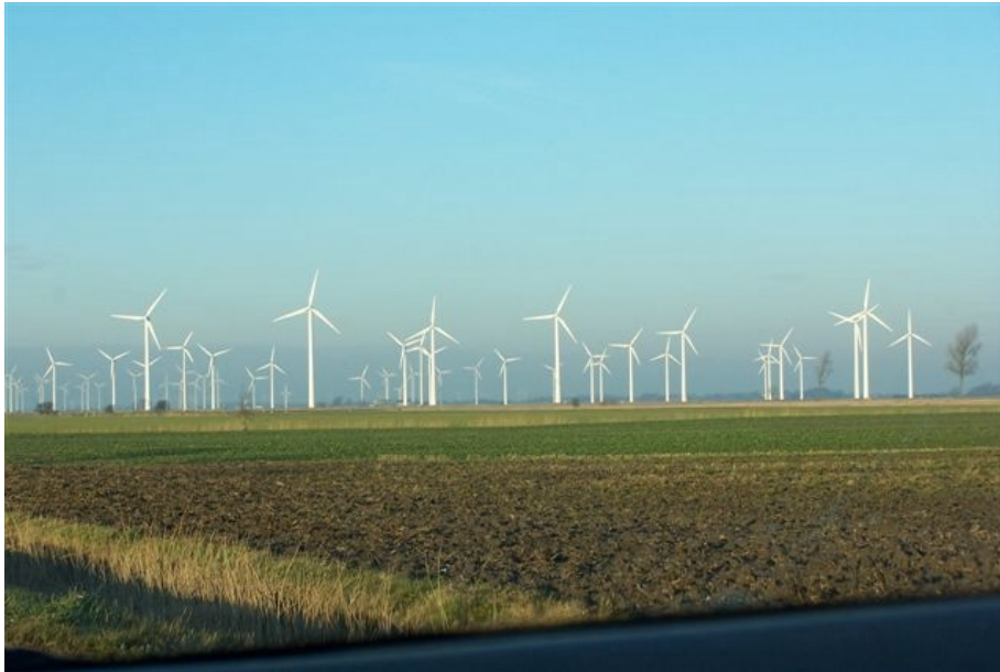
Abb. 1: Flächenhafte Überstellung mit WKA

um grundlegende Voraussetzungen für die Durchführung von Gentechnologie und für die gentechnische Produktion neuer Lebensmittel, Energiepflanzen, Industrie- und Pharmarohstoffe. Mit ganzheitlichem Naturverständnis, wofür der Naturschutz einst angetreten war, haben solche Naturschutzziele oftmals nur wenig zu tun. Die schon im Mittelalter vollzogene Trennung der Natur in einen ‚valor naturalis‘ und einen ‚valor usualis‘, also die Zerlegung der Natur in einen allgemeinen Naturwert und einen Nutzwert (IMMLER, 1985) wird im modernen Naturschutz mit dem Konzept der Biodiversität – gewollt oder ungewollt – wieder aufgegriffen und vertieft.