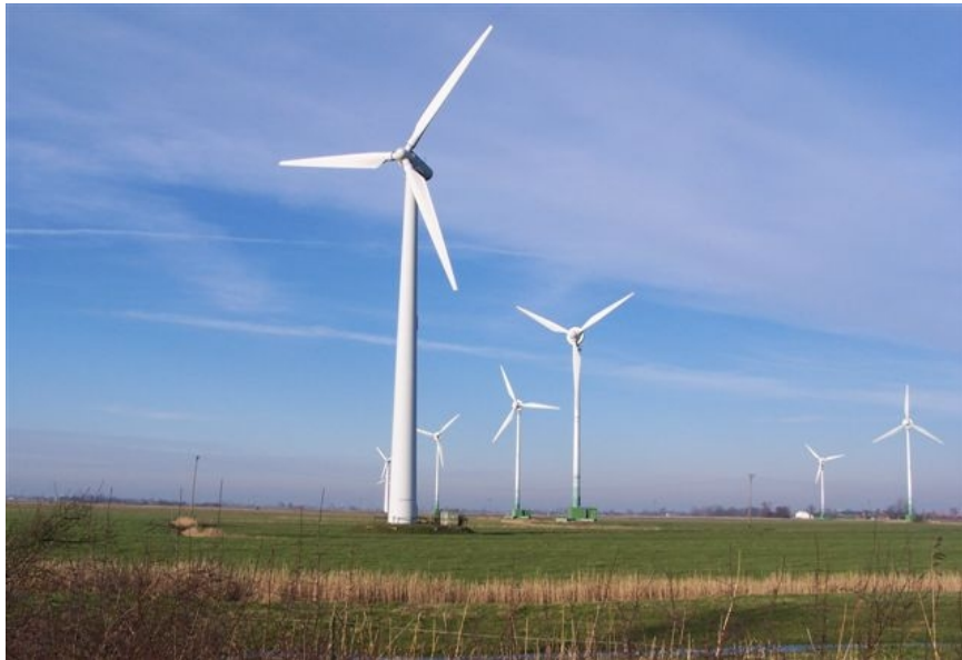
Abb. 9: Windkraftanlagen - ohne Bezug zum Maßsystem der Landschaft

sächlich können in diesen Gegenwelten, auch wenn sie agrarisch und forstwirtschaftlich intensiv genutzt werden, nach wie vor Naturvorgänge, wie das Wachstum der Nutzpflanzen, floristische Ereignisse wie Blühaspekte (Raps- Phacelia-, Sonnenblumenfelder oder Löwenzahn-, Knöterich-, Kerbel-, Hahnenfuß-, Margaritenwiesen usw.), Ackerunkräuter auf Wegrainen, Vegetation in und an Gräben, Hecken, Waldränder, Tiere insbesondere Vögel, Wind- und Wettererscheinungen in vielfältigen Formen, Wolkenbilder, Vogelstimmen, Grillenzirpen usw. bei den alltäglichen Besuchen beobachtet und ästhetisch erlebt werden (Abbildung 8).