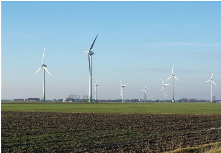
Abb. 11: Maßstabsverluste

Die von Masten hervorgerufenen landschaftsästhetischen Beeinträchtigungen sind zwar überwiegend visueller Natur, im räumlichen Kontext der Landschaft sind sie aber dennoch sehr unterschiedlich. Um das ganze Ausmaß der ästhetischen Verunstaltungen und Zerstörungen systematisch und detailliert zu erfassen, sollten sich entsprechende Verfahren in Zukunft stärker an den tatsächlichen ästhetischen Beeinträchtigungen orientieren. Die nachfolgend dargestellten landschaftsästhetischen Auswirkungen treffen nicht auf jedes Eingriffsvorhaben zu, aber in ihrer Zusammenschau verdeutlichen sie, was mit unseren Landschaften ästhetisch tatsächlich passiert, wenn sie mit gigantisch hohen, turmartigen Bauwerken überstellt werden (NOHL, 2006b). Ich beziehe mich im folgenden auf Windkraftanlagen, das gesagte gilt aber vielerorts auch für andere mastenartige Eingriffe.