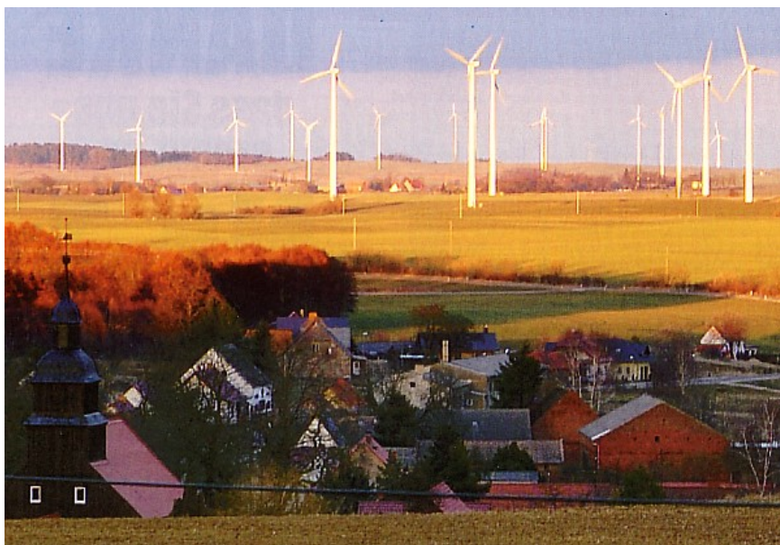
Abb. 5: Gigantische Höhen der neuen WKA-Generationen

In der nun folgenden kritischen Einschätzung des Verfahrens möchte ich zuerst einige Entstehungsbedingungen thematisieren, nämlich die damals noch relativ bescheidene Höhe der Eingriffsobjekte und zweitens die damals noch fehlende allgemeine Privilegierung der Windkraftanlagen. Danach möchte ich dann auf zwei Besonderheiten des Verfahrens selbst zu sprechen kommen, die sich nachträglich als kritisch erweisen, wie die Tatsache, dass die Ästhetik in diesem Verfahren nur Mittel zum Zweck ist, und dass die Anwendung des Verfahrens gegen Manipulation leider nicht gefeit ist.