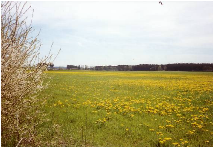
Abb. 8: Löwenzahnwiese als Ausdruck erlebter Natur

Bezüglich der Naturausstattung ist der Unterschied zwischen diesen beiden Zonen i.A. so groß, dass der Außenbereich die meisten Menschen als ein durchaus naturnaher Ort anmutet. Das bedeutet, auch heute noch erleben die Menschen die agrarisch und forstlich genutzte Landschaft im Außenbereich – im Gegensatz zum besiedelten Innenbereich – in aller Regel als ein Bild des friedvollen, ästhetisch-emotional anrührenden Naturganzen, das sie in den Siedlungs- und vor allem in den verstäderten Gebieten oft vergeblich suchen, dort bestenfalls in Surrogatformen wie Parkanlagen oder Gärten angedeutet vorfinden. Eben weil die Menschen wissen, dass sie nicht nur Geist sind sondern auch Natur, möchten sie sich dieser Natur auch vergewissern können. Daher gehen sie in die Landschaft, daher wird ihnen diese Umgebungslandschaft zur alltäglichen Heimat (NOHL, 2006).