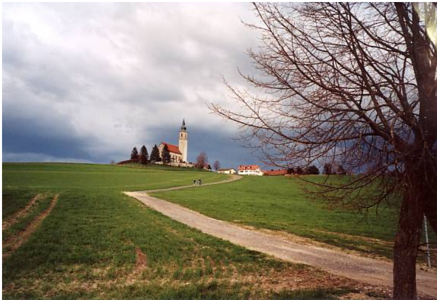
Abb. 7: Kulturlandschaft