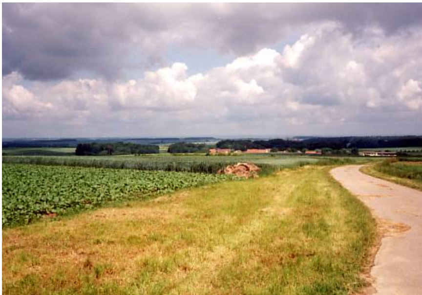
Abb. 6: Naturnähe im ästhetischen Sinne

Genau genommen macht das von mir entwickelte Kompensationsflächenverfahren keine Aussagen zum ästhetischen Zustand einer Landschaft. Vielmehr zielt das Verfahren darauf ab, im Falle von Landschaftsbildbeeinträchtigungen das Maß der Kompensation in m 2 Fläche zu ermitteln. Die im Verfahren zur Anwendung kommenden Indikatoren wie Vielfalt, Naturnähe, Eigenart u.a. sind also nur Mittel zum Zweck. Landschaftsästhetische Argumente werden hier nur verwendet, um diesen nicht-ästhetischen, profanen Zweck der Kompensationsflächenermittlung einsichtiger zu machen. Methodisch hätte man auch ganz anders vorgehen können (z.B. Kompensationsflächenumfang in Abhängigkeit von der Masthöhe). Wir haben damals diesen in Teilen ästhetisch „begründeten“ Weg gewählt, weil wir uns davon ein größeres Aha-Erlebnis, mehr Nachvollziehbarkeit und mehr Akzeptanz versprochen.