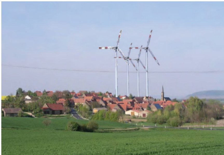
Abb. 12: Verlust der landschaftlichen Eigenart

Durch die Errichtung von Windkraftanlagen kommt es meist zu starken Beeinträchtigungen der naturräumlichen und kulturräumlichen Eigenart der Landschaft. Solche Auswirkungen werden von den meisten Menschen als gravierende Heimatzerstörungen erlebt. Windkraftanlagen mit ihren hohen Schäften und weit ausladenden Rotoren stellen völlig unangemessene, landschaftsfremde Strukturen dar, die sowohl das kulturräumlich als auch das naturräumlich bedingte Elementenrepertoire der meisten Landschaften negieren, und die damit verbundene landschaftliche Unverwechselbarkeit ästhetisch erheblich und nachhaltig einebnen. Die charakteristischen Erscheinungsbilder unserer Landschaften, über die sich für ortsansässige wie für sonstige Erholungssuchende die heimatliche Umgebung definiert, und ohne die sich im ländlichen Raum keine lokale Identität herausbilden kann, werden durch Windkraftanlagen und Windfarmen fast immer in ganz erheblichem Maße in Mitleidenschaft gezogen (Abbildung 12).